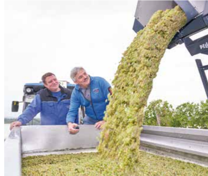
Unsere neue Lesemaschine Pellenc Grapes' Line sortiert perfekt die Trauben

Der Hagel hat die Erntemenge in den betroffenen Weingärten (ca. 40 ha) stark minimiert. Durch die ideale Witterung mit sehr viel Sonnenschein, gibt es jedoch keinen Qualitätsverlust. Überrascht sind wir von der sehr hohen physiologi-