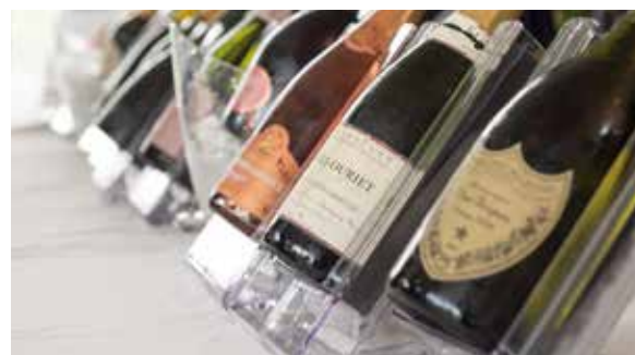
Die besten Champagner zum Verkosten