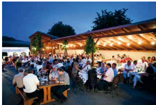
Beste Stimmung am Heurigenhof