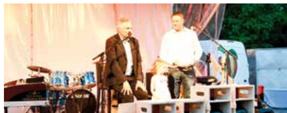
Verlosung der Großflaschen