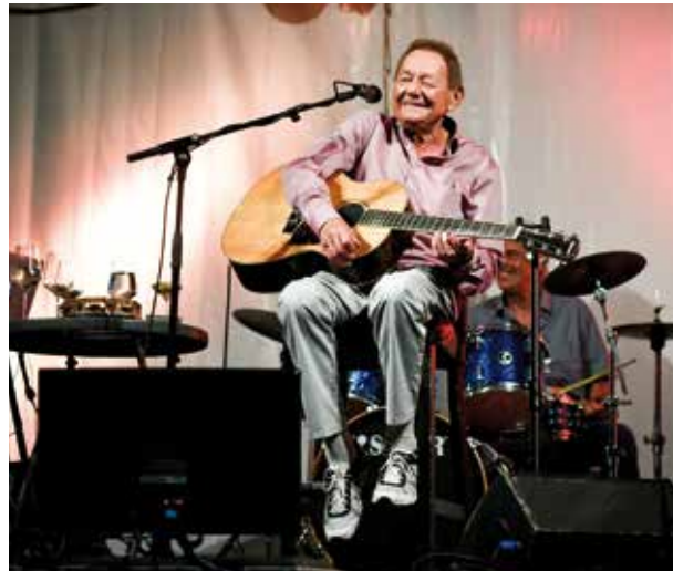
Mein lieber Freund Wolfgang Ambros

Der Höhepunkt dieses Abends war das Open Air Konzert von Wolfgang Ambros.